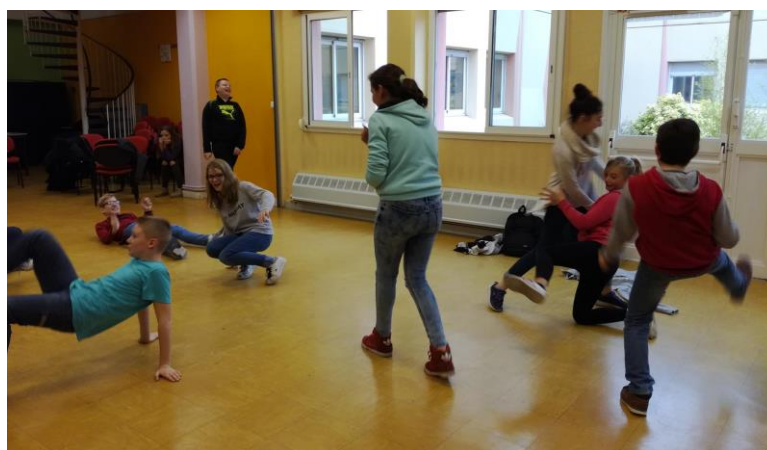
Les élèves lors d'exercices de déplacements

L'après-midi, les artistes du Collectif Zirlib ont mené des entretiens individuels avec les élèves afin de mieux les connaître.