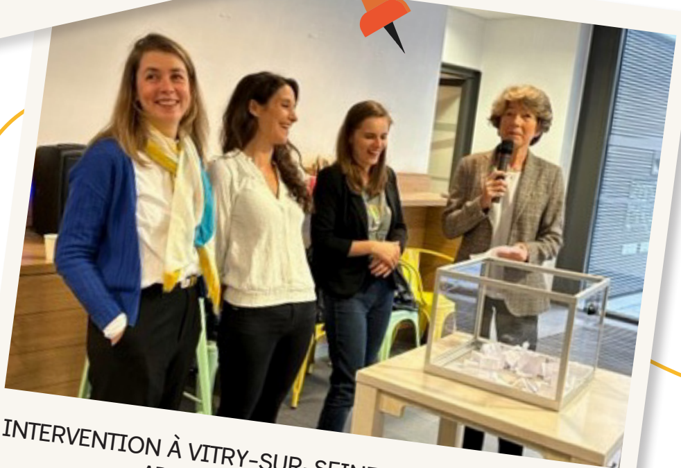
INTERVENTION À VITRY-SUR-SEINE DE NOS PARTENAIRES APPRENTIS D'AUTEUIL ET L'ENVOL