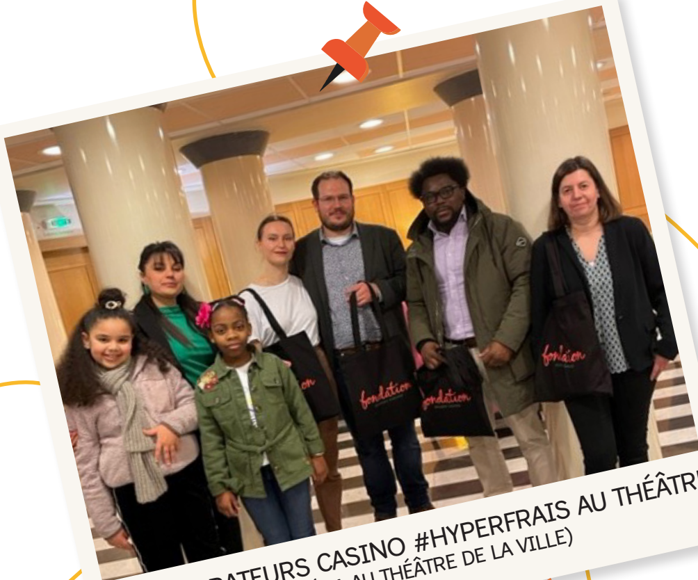
COLLABORATEURS CASINO #HYPERFRAIS AU THÉÂTRE (MASSÉNA AU THÉÂTRE DE LA VILLE)