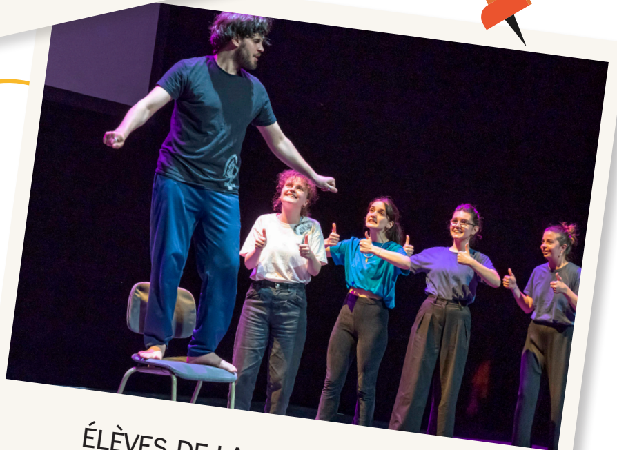
ÉLÈVES DE LA CLASSE LAURÉATE