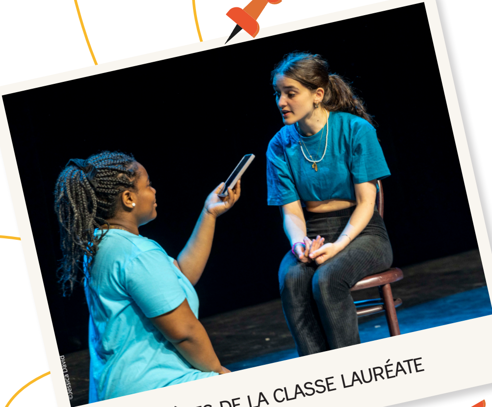
ÉLÈVES DE LA CLASSE LAURÉATE